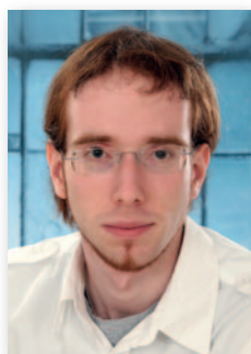
DOMINIK HATZIGMOSER GRAFIK, LAYOUT & BERATUNG

☎ +43 650 / 460 28 54 HELENA@WOHNTRAUMAUTO.AT